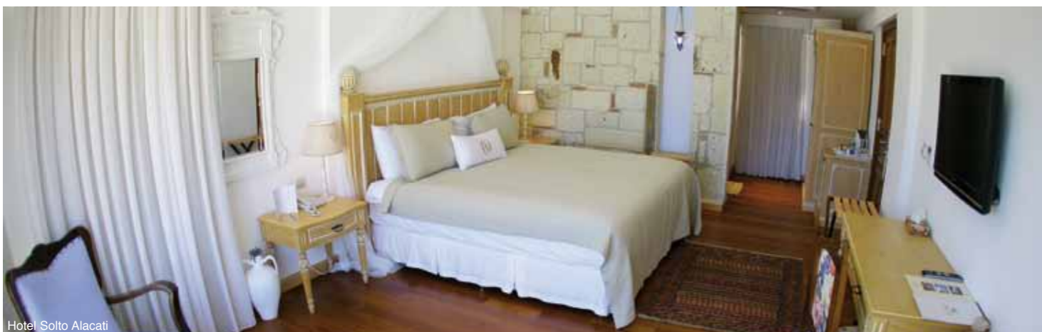
Hotel Solto Alacati