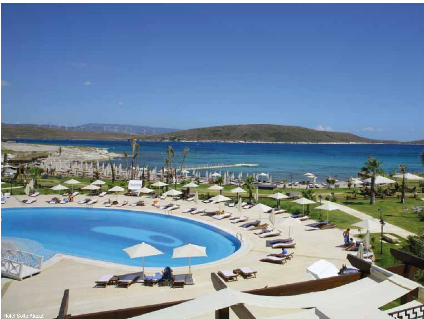
Hotel Solto Alacati