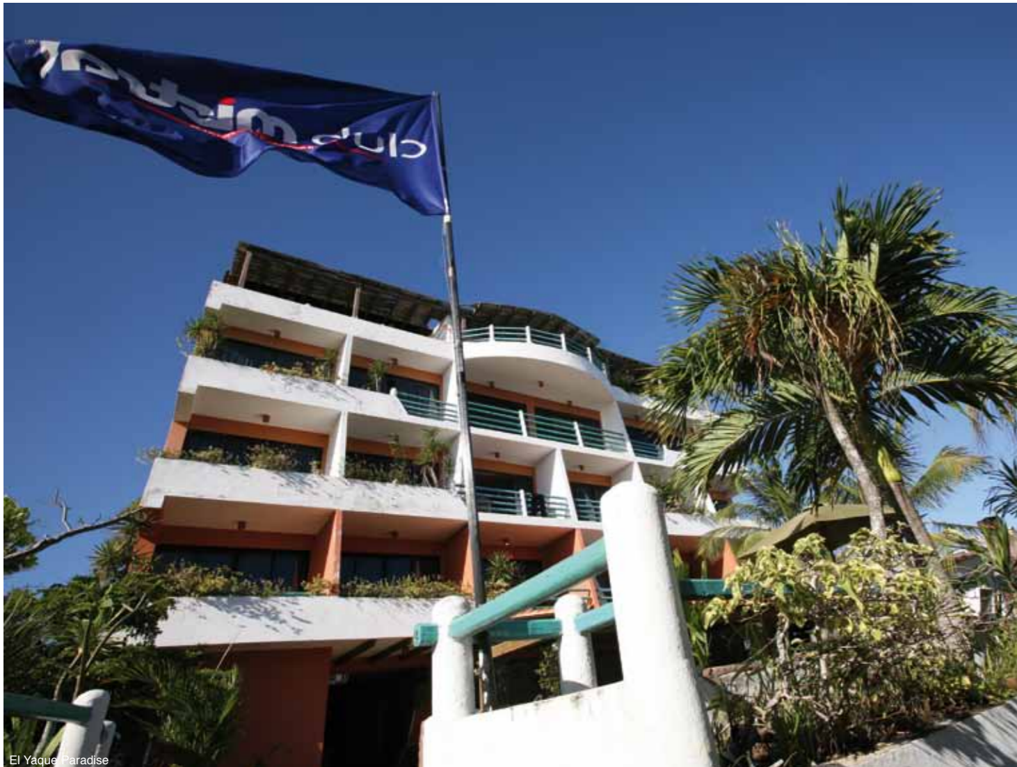
El Yaque Paradise

1 Woche DZ/ÜF inkl. Flug & Transfer ab 1205 EUR pro Person