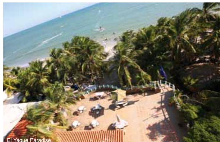
El Yaque Paradise