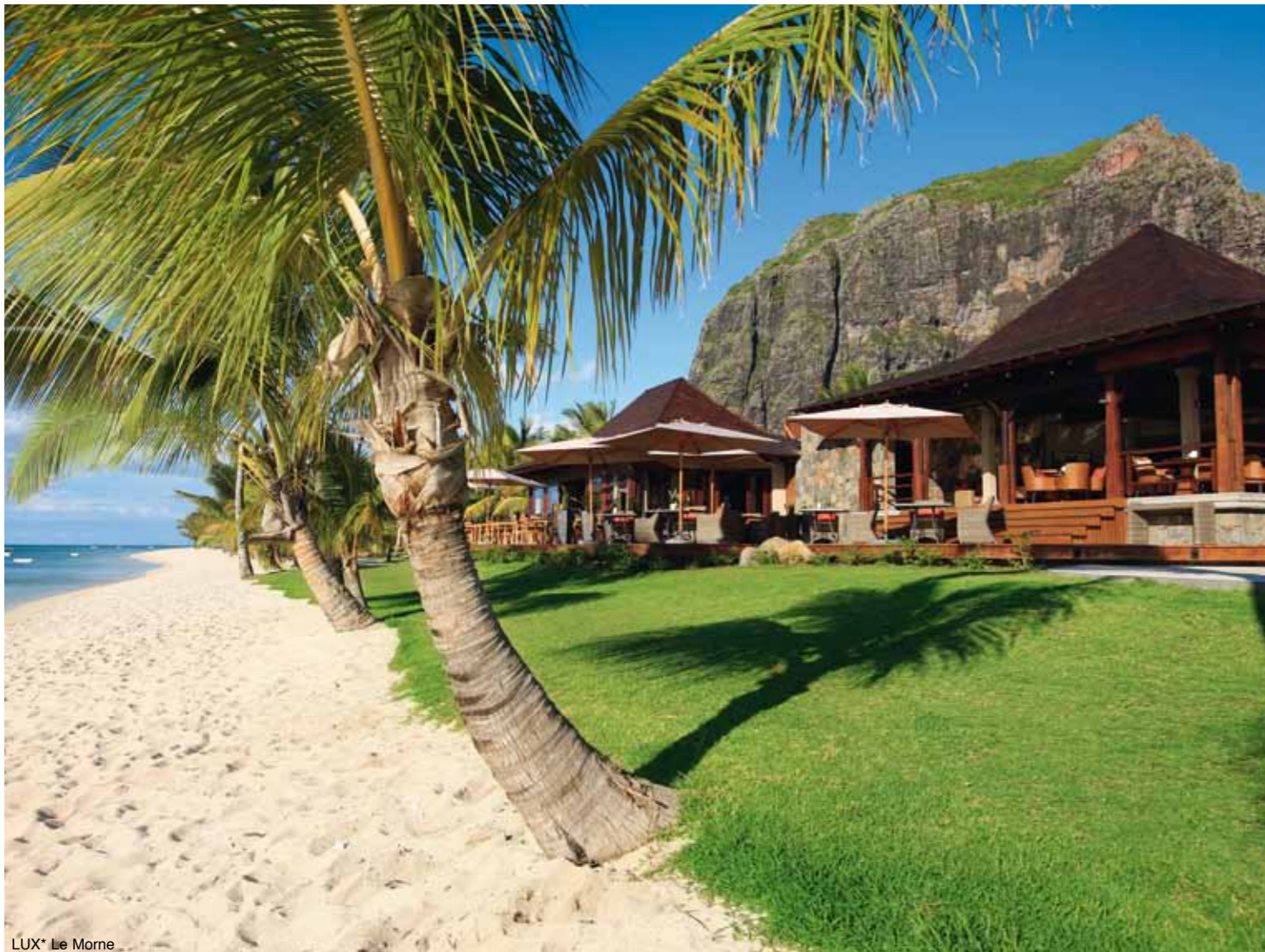
LUX* Le Morne