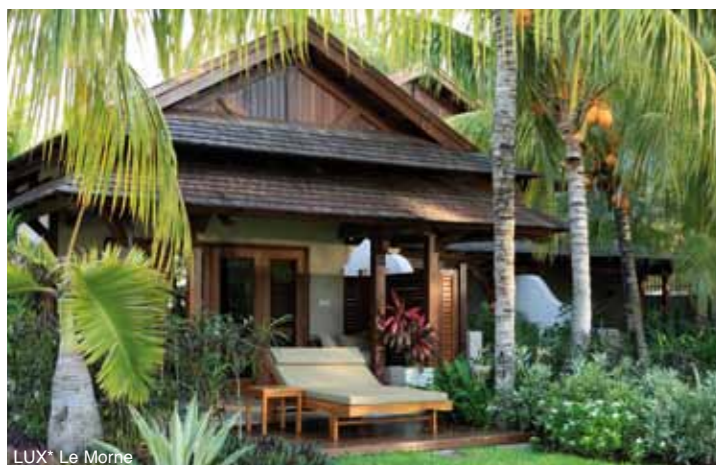
LUX* Le Morne